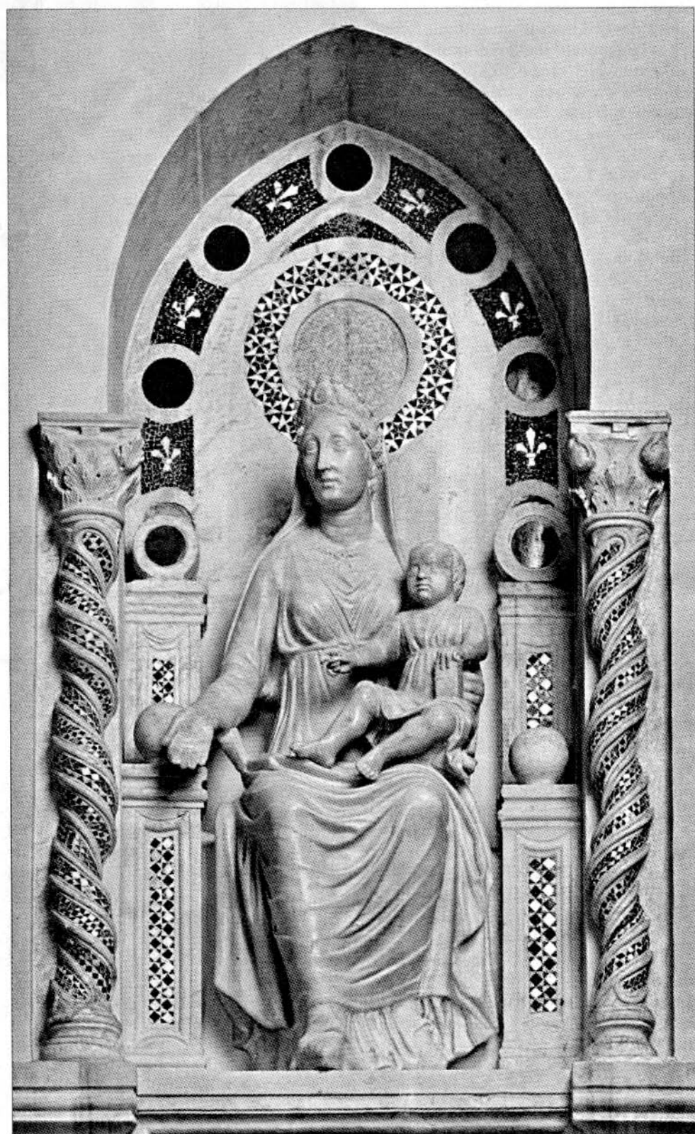
Particolare della Madonna col Bambino

Non diversamente, più o meno negli stessi anni, opera l'Alighieri quando scioglie l'ossificato latino dell'Università e della Chiesa, negli idiomi nuovi d'Italia e d'Europa: il toscano, il veneto, il lombardo, il provenzale, il francese. Così da costruire, come Arnolfo — non tanto nella memoria dell'antico, ma piuttosto nella sua disinvolta appropriazione assimilazione e trasfigurazione — la nostra lingua letteraria.